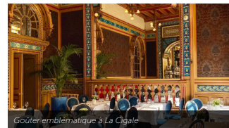
Goûter emblématique à La Cigale

~~~~~ Réservez votre séjour et explorez Nantes à votre rythme.